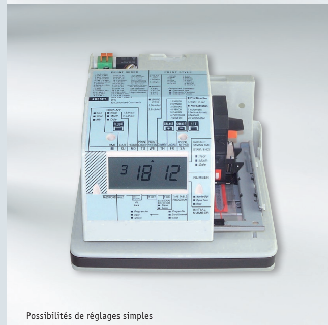
Possibilités de réglages simples